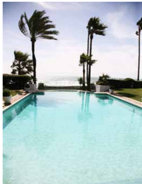
▲ Vista desde la piscina de Marbella Club Hotel.

vierte en los habitantes de la localidad con proyectos como la clínica de enfermeras, el tratamiento de la malaria y el cuidado de las mujeres embarazadas y recién nacidos. De Sudáfrica a la Formula 1 de Italia, en la coqueta ciudad de Monza, donde el Hotel de la Ville, que va ya por su cuarta generación, ha acogido a los corredores de Fórmula 1 del GP italiano desde 1958. Cheval Blanc es un embajador directo del arte de vivir que se siente en cada rincón de su espectacular mansión, como en todas las instalaciones del LVMH Hotel Management al que pertenece, localizadas en Courchevel, Maldivas, San Bartolomé, San Tropez y, pronto, en París. Lugares especializados en el refinamiento, la imaginación y el talento para complacer hasta el último detalle las necesidades y caprichos del huésped.